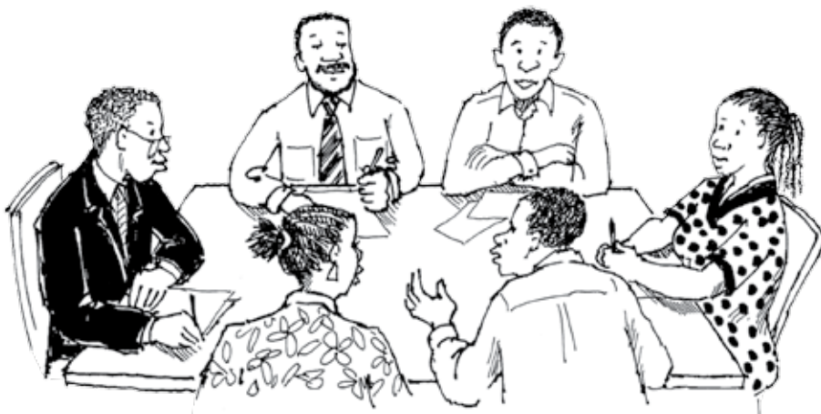
Ilustração: Petra Röhr-Rouendaal, Where there is no artist (segunda edição)

Todas essas questões precisam ser abordadas ao lidarmos com a mudança climática. Isso ajudará a garantir que nosso futuro seja seguro e sustentável. As Nações Unidas produziram uma nova série de 17 Objetivos de Desenvolvimento Sustentável para os 15 anos entre 2015 e 2030. Esses objetivos orientarão os esforços dos governos, sociedade civil e empresas para que se tornem mais sustentáveis.