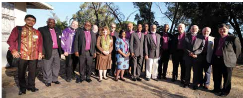
Os Bispos Ecológicos, na África do Sul.