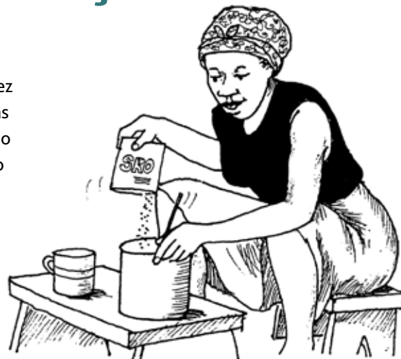
Ilustração: Petra Röhr-Rouendaal, Where there is no artist (segunda edição)

Se alguém estiver sofrendo de exaustão pelo calor, as bebidas reidratantes poderão ajudar.