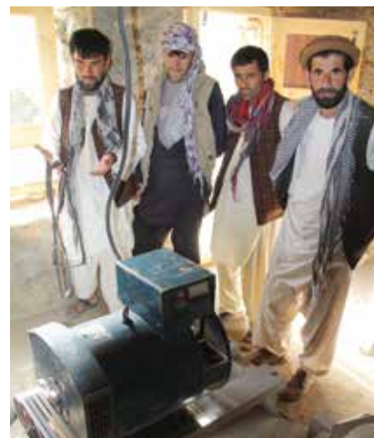
O trabalho conjunto nos projetos de microusinas hidroelétricas ajudou a unir comunidades.

Além disso, o processo de entrar em acordo e instalar uma microusina hidroelétrica ajuda a unir a comunidade. A parceira da Tearfund só se compromete a ajudar a instalar uma usina elétrica depois que todas as famílias da comunidade confirmaram que é isso o que