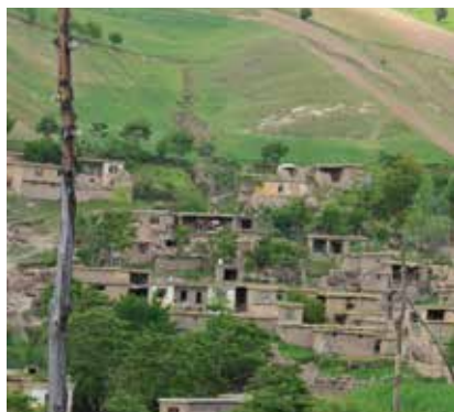
A parceira da Tearfund instalou 325 microusinas hidroelétricas em zonas rurais do Afeganistão.

Uma parceira da Tearfund está trabalhando em uma província no nordeste do Afeganistão. Esta é uma das regiões mais pobres e menos acessíveis do país, embora seja muito bonita. Com frequência, é impossível viajar nas estradas irregulares, e, às vezes, as pontes são arrastadas pelas inundações. Em trabalho conjunto com os membros das comunidades, a parceira da Tearfund já instalou 325 microusinas